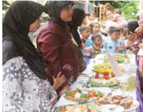
Lomba Panganan berbahan dasar tempe dan ikan

Setelah beroperasi hampir 2 tahun, RW Siaga Plus telah membuktikan banyak keberhasilan yang terbukti salah satunya dari tingginya partisipasi masyarakat (750 orang), dalam hal ini